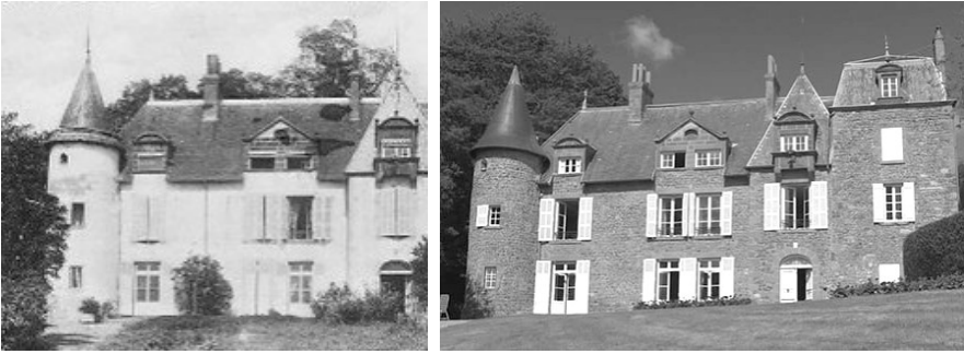
Afbeelding: geboorteplaats van Teilhard: kasteel Sarcenat in 1890 en tegenwoordig

Van zijn vader erfde Teilhard een levendige belangstelling voor de natuurwetenschappen. Zijn moeder was een achter kleinnicht van Voltaire. Zij hield zich vooral bezig met de godsdienstige opvoeding van haar kinderen. Haar overgrootoom – de man van ‘ Ecrasez l’Infâme 1 – zal zich daarbij wel eens in zijn graf hebben omgedraaid! De vader voelde het als een plicht zijn hartstocht voor het natuuronderzoek over te dragen op zijn kinderen. Verzamelingen van planten, insecten en... stenen werden aangelegd en de vakanties werden doorgebracht met excursies op de eigen landgoederen.