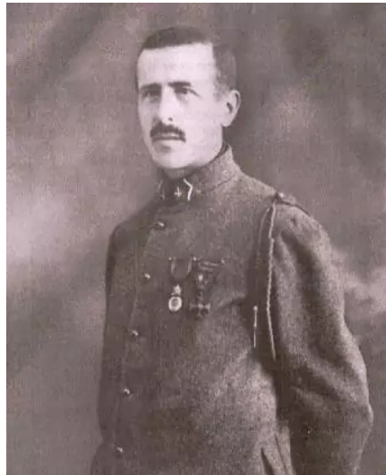
Afbeelding: Teilhard als brancardier in WO I