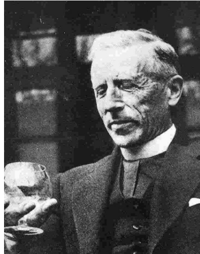
Afbeelding: Carl Gustav Jung en Pierre Teilhard de Chardin

Bij een vergelijking tussen Jung en Teilhard de Chardin, lijkt het ons goed om eerst wat dieper in te gaan op Teilhard de Chardin. Bij de leden van onze Jung Vereniging zal hij wat minder bekend zijn, te meer omdat hij de laatste decennia wat in de vergetelheid is geraakt. Wij zullen daarom eerst een biografische schets van hem geven, vervolgens een samenvatting van zijn theorieën. Daarna zijn we misschien beter voorbereid op een vergelijking tussen beide heren.